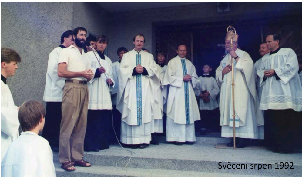
Svěcení srpen 1992

INFOLINKA: INFOLINKA: INFOLINKA: INFOLINKA: INFOLINKA: